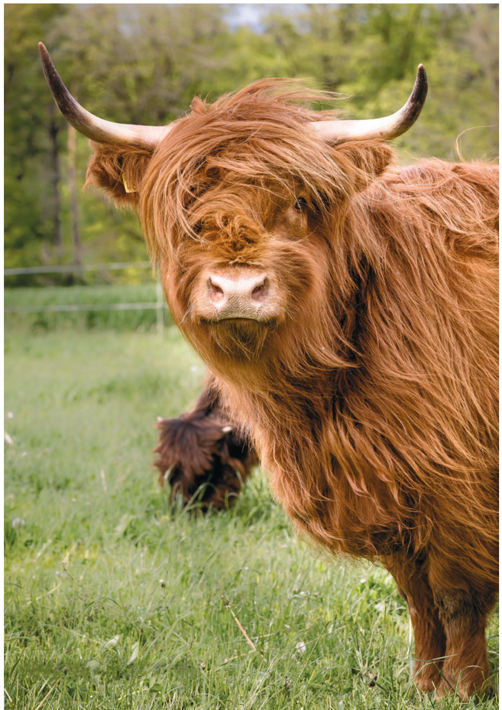
Das Schottische Hochlandrind Fabsy in Desibach auf der Weide.